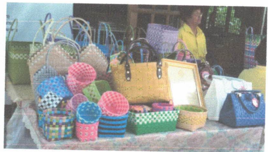
กลุ่มจักสานงานฝีมือ