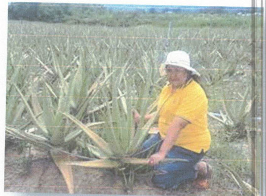
กลุ่มผู้ปลูกวางจระเข้