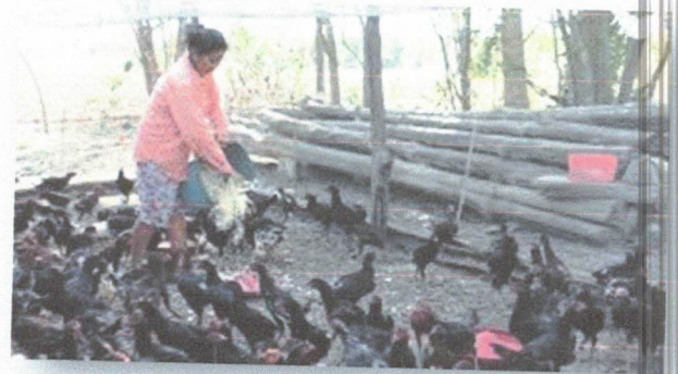
กลุ่มผู้เลี้ยงไก่พื้นเมือง